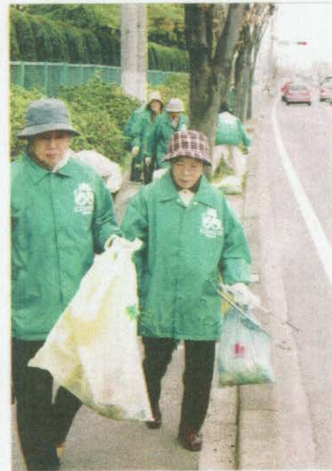
4月23日(日)第1回まち美化運動(アガリ運動) 県道旭川線と清掃するボランティアの会員。

モリコロパーク十五日開園 もどろ米に ガツキとメイの家 二月十八日(土)地域環境活性化協議会が発足いたしました。矢田川水系環境美化プロジェクト協議会 松達と県・市の協働でのボランティア活動です。 事業計画 ・県市を含めての美化運動実施 ・四季の花を公園に「公園愛護会」 ・四季の花を止のテーマ成立を後 ・矢田川水系環境美化プロジェクト協議会 参加 ・矢田川に親しみ公園をより楽しくする為に参加