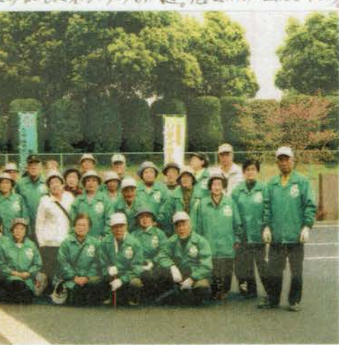
第1回美化運動に参加したボランティアのメンバーの記念撮影

協働行政連絡先 尾張旭市 都市計画課 建設部 土木課 私もボランティアに参加したい方!!