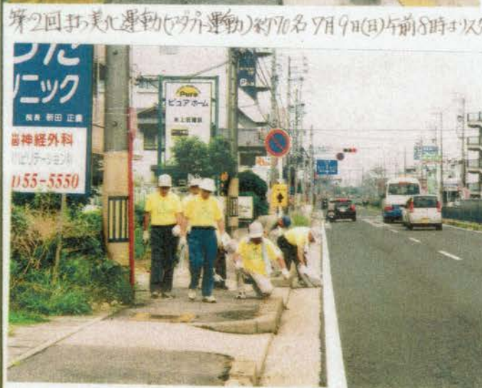
第2回まち美化運動(アガリ運動)約70名が7月9日(日)午前8時よりスタート

協働行政連絡先 尾張旭市 都市計画課 建設部 土木課 私もボランティアに参加したい方!!