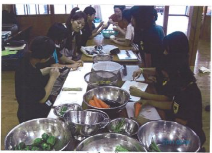
▲みんなで作るカレーのおおき。夏野菜と真剣さ。