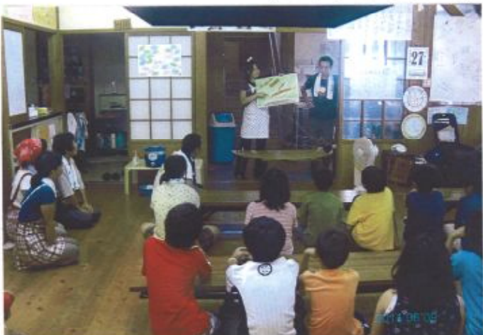
▲カレーづくりの説明、皆さんで聞か。