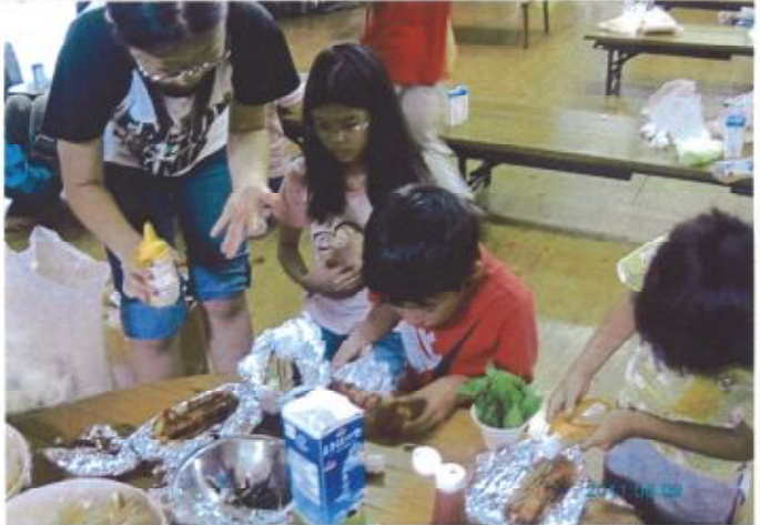
▲ 食 野 球 予 合