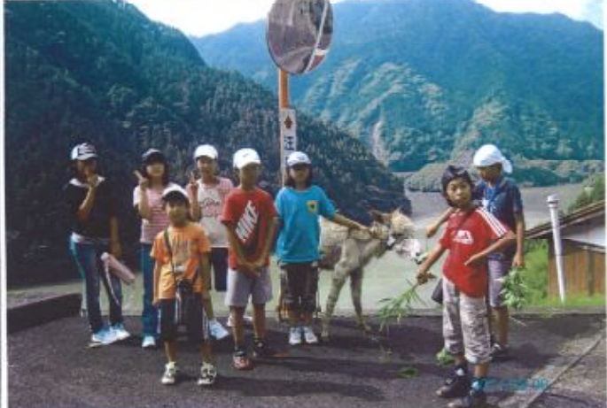
旭村 の小中 生4名 朝日元丸