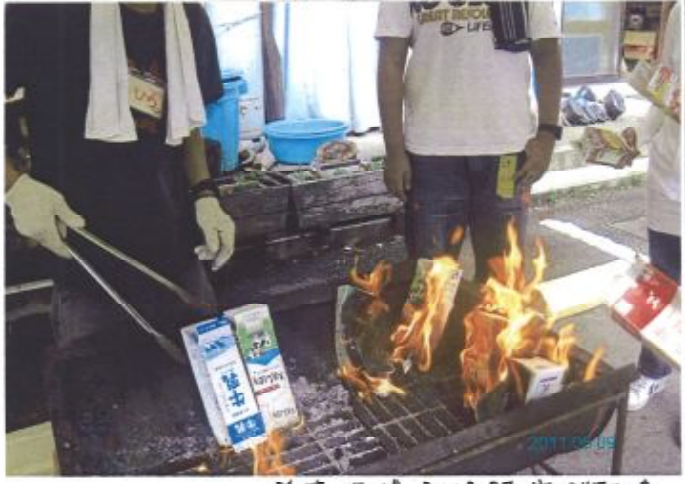
▲ 朝のホット ドンゴツリ 牛乳パンに 銀紙に包み パンをそのま ま入れて パンを焼い るまで待つ すて燃え 後と……