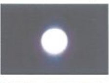
9時05分 ラストショーへ