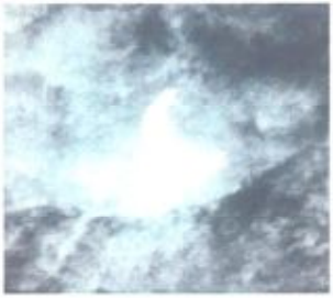
雲が出始め、ヒヤリ