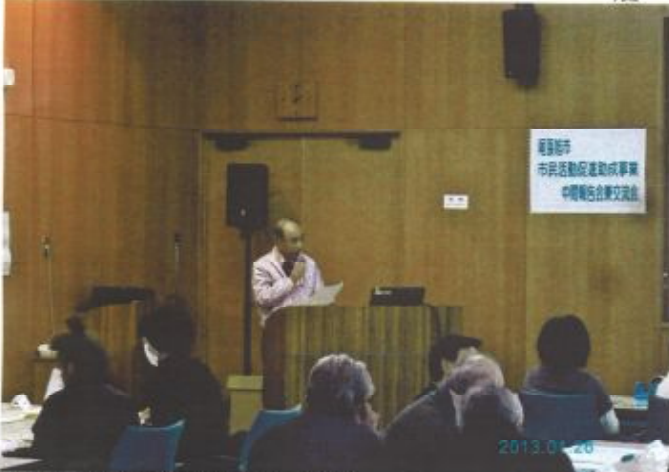
▲Tバぶの地協会で発表する代表者。