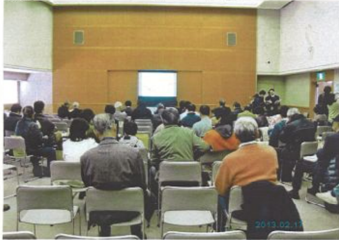
2013.02.17 ▲発表会 筆部 終了の 休憩 時間

平成二十五年二月十七日(月) 愛知県図書館大会 議室。午後一時五分 から午後四時まで。 出席者は約300名 発表内容は三河地域の 緑の育成活動 事業の名称で、 間伐・植樹体験型 環境学習(緑のカー テン)と植物(緑化) の生育実習などの中 心の発表会であった。 来年は水と緑の息 み体感事業で 心と自然活動の発表 を申請しようと思える。