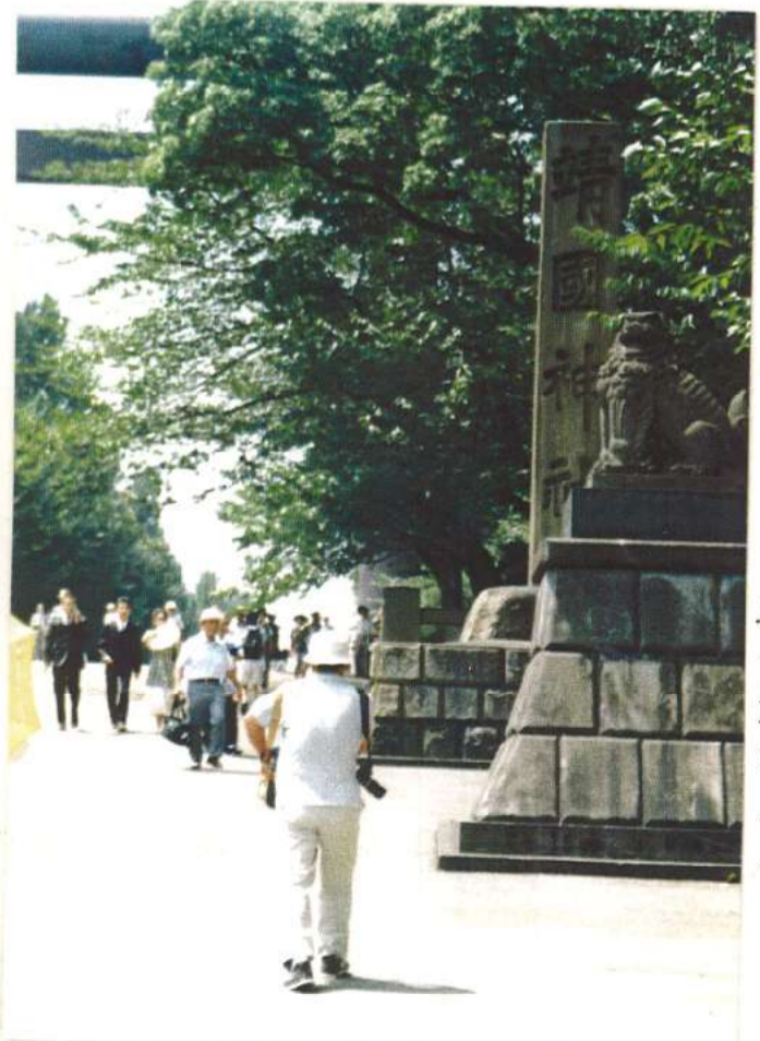
靖国神社参道より

不毛の議論を繰り返さないため にも夏に限り通年戦争と靖国 戦後をめぐり冷静な議論を本殿 積み上げていく必要があるのでは いか、追憶と追悼の夏を乗りこ なれば爽やかな秋は訪れない。