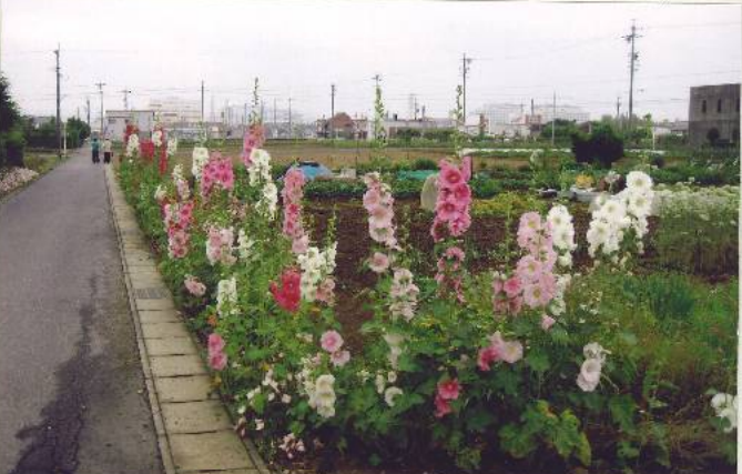
四季折々の花が散道する季節によって変化が、家庭菜園も同様。