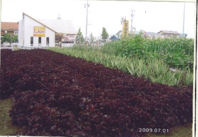
長久平と尾張旭市と結ぶ図書館通り。