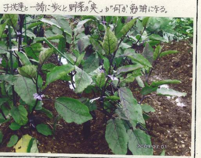
子供と一緒に歩くと野菜の「実」が何か「勉強」になる。