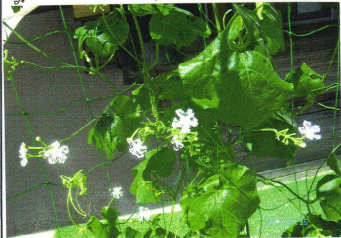
▲花がきれいですが ▲雪の結晶花

原産国アメリカ カでは健康 野菜として重 宝され病院 食としても用 いられます。 セイロン瓜は低 カロリー野菜で カリウム、マグネシ ウム、カルシウム などのミネラル 類が含まれてい ます。