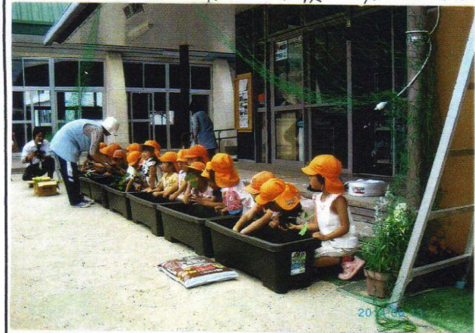
▲6月13日本当に実がなるのはいいな。

セイロン瓜栽培には20℃以上の 温度が必要で、栽培を初めてか ら収穫が終わるまで約4か月 間かかります。 セイロン瓜は、つる性なので、支柱や 柵を使って栽培します。 果実は2週間ごろから食用に 使えます。 自然にして置くこと、地の上にくねって しまつものもあります。 適度の重りをつけると、まぶさな 形になります。 実がなり始める時に追肥をすると 栄養状態が良くなり、ふしりに実 が成ります。セイロン瓜は、畑などで 地植えのほか、鉢植え、プランター栽培 にも適しています。 バランダーでも簡単に栽培できます。 つるが伸びてきました。