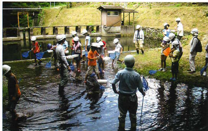
◀子ども環境大賞(東海大学水産生物 学研究所)で水生生物 調査体験学習