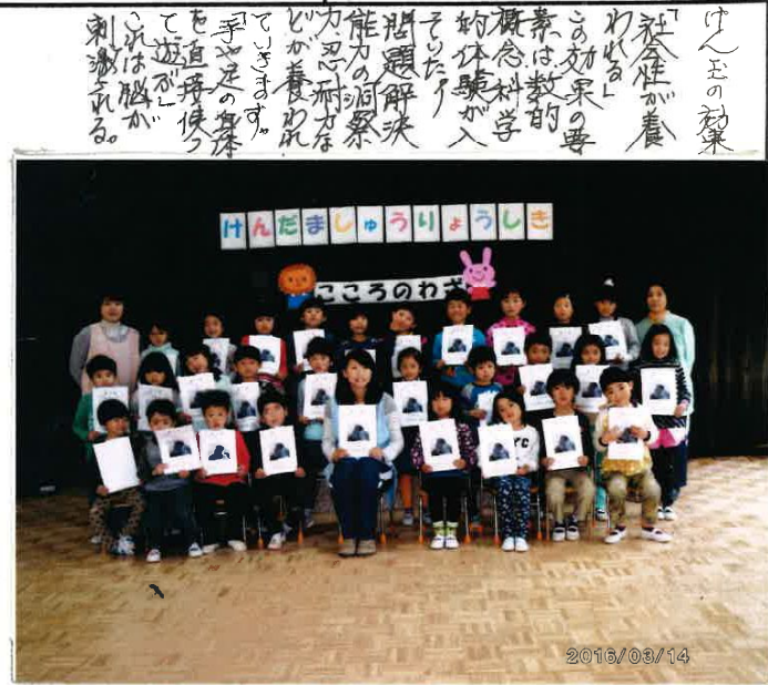
みんな1年間よくがんばった!

食育のススメ ミレニウイ子は豚肉で、おやつおしりかっただよ、みんな、みんなのおおわかれです。