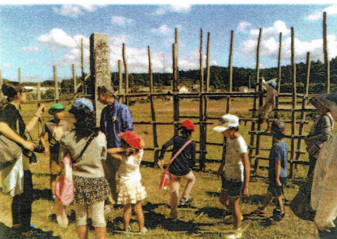
▼ 馬防棚で説明をする代表。