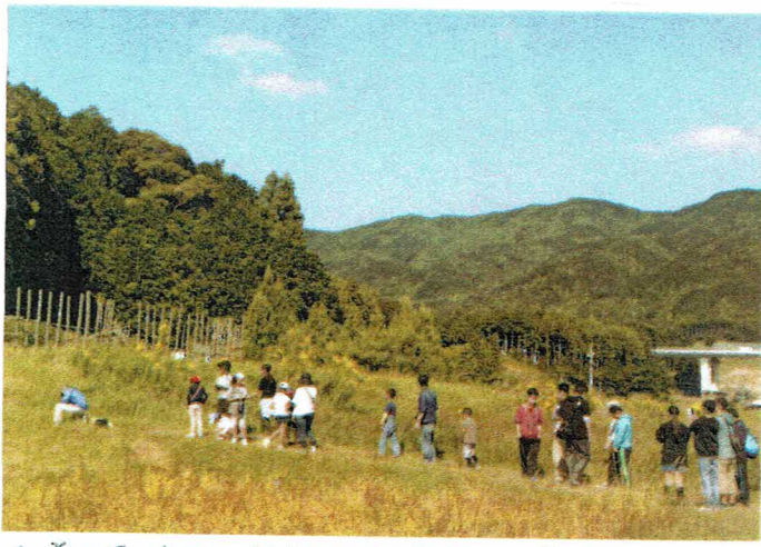
▲ 東三河の玄瀬川。新東名高速の新城ICの姿も遠くに見える。