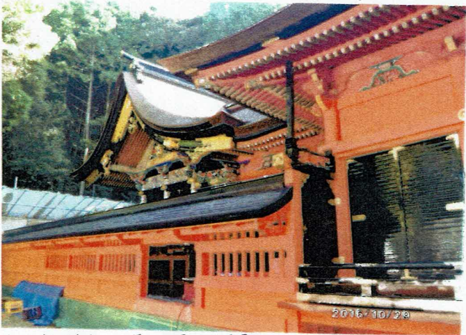
▲六社神社を模した風景