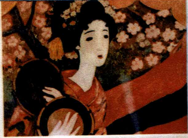
無題 (大蔵を待つ) 2017/05/12 婦人クラ とさば五時

発行所：地域環境活性化協議会 編集者：代表幹事 高橋 賢一 連絡先：市民活動支援センター 尾張旭市渋川町三丁目5番地7 (渋川福祉センター内) TEL 0561-51-2878