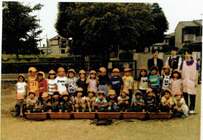
本地原保育園 本地原保育園全員撮影