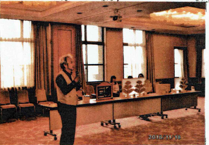
▲おもて工房トノ の清水氏の作。