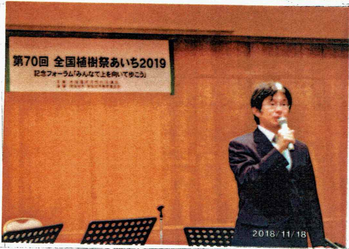
第70回 全国植樹祭あいち2019 記念フォーラム「みんなで上を向いて歩こう」