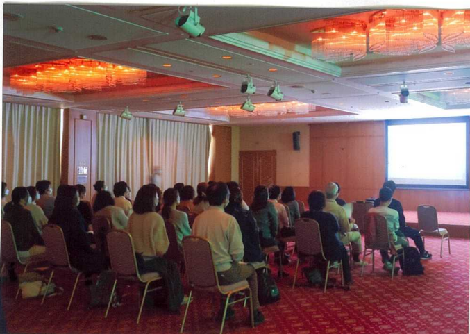
〈音楽と映像〉も少しで、2023年の完成を喜びに

森林浴だけでなく、 花や木、川の音 などの自然には 本年から音楽 適正値に近づけ る作用があり、人間 のあるべき状態に 戻す効果がある ことがわかってい ます。 森林を歩くと、血圧 の高い人は低下し、依 人は上昇します。 科学的データの裏 付けのある自然が もたらす心身への 良効果として 自然セラピーを意義 としています。